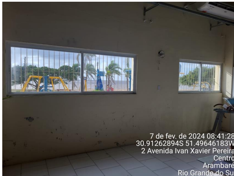
Figura 2- porta lateral esquerda, em substituição a janela existente.