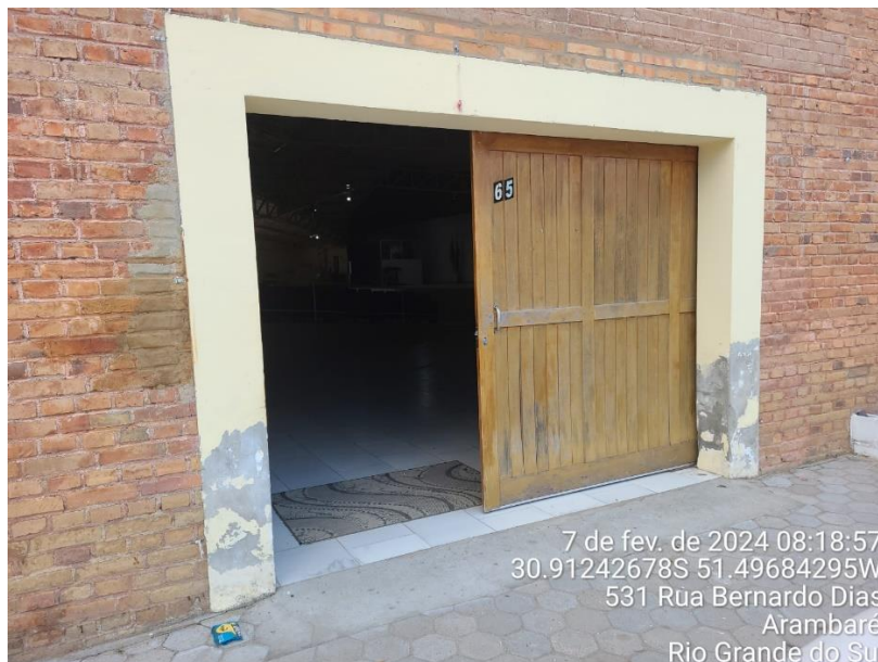
Figura 1- porta lateral direita a ser substituída.