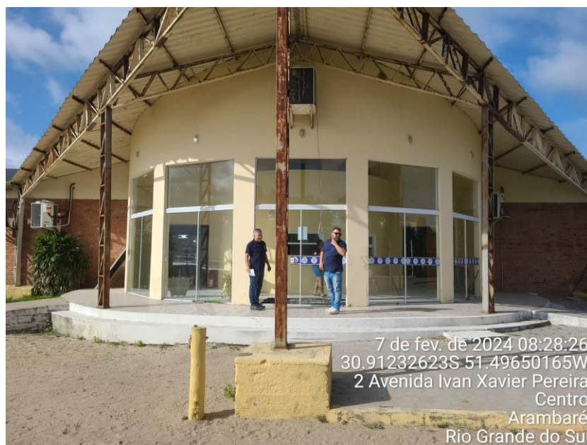
Figura 3- portas frontal, 3 portas a substituir.